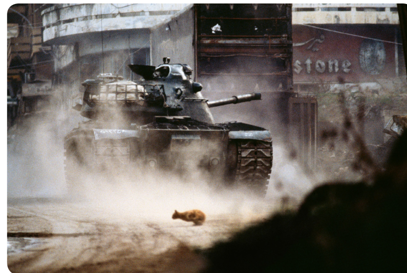
"Liban, 1984. Un tank de l'armée libanaise chrétienne tire sur les milices musulmanes dans le centre-ville de Beyrouth. Un chat de religion indéterminée fuit les combats." P. Chauvel